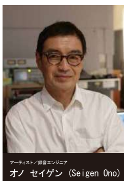
(プロフィールと作品)